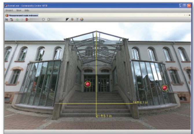
3D meranie na snímkach